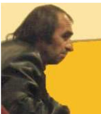
Legendární osobnost stránek – komentátor Havraní vlas

Úplně se s vámi však rozloučit nehodláme, nadále budeme přispívat do rubrik "Osobnosti" a do nově vytvořené "Knihovny", kde si v budoucnu budete moci přečíst různé historky a příběhy ze života pětibod'áků a čtyřbod'áků, které jsme stačili během našeho více než ročního recenzování nasbírat.“