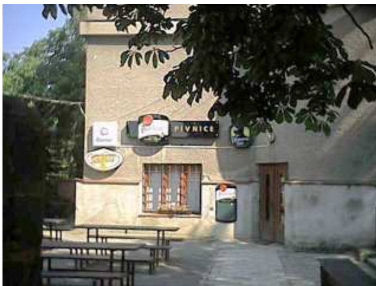
První fotografie z Jarynova digitálního fotoaparátu – Pivnice Sokolovna

Napřesrok si Jaryn pořídil digitální foťák a započalo se s recenzováním dalších hospod. Zpočátku, jak říká Jaryn, brala porota recenzování jako neškodnou zábavu. "Dělali jsme to pouze pro sebe a pár kamarádů. Umístil jsem recenze na svoje internetové stránky, na kterých jsem měl průměrně 5 přístupů denně.", dodává.