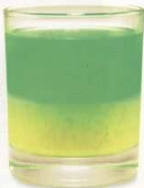
Zelený mozek čili četař: vaječný koňak pomalu nalévej do zelené.