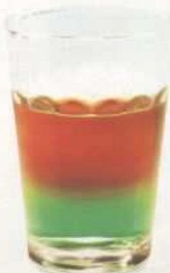
Koně v trávě, jinak též halí belí: na peprmintový základ zvolna nalij dávku rumu.