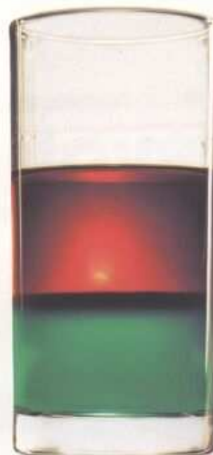
Vetřelec aneb cesta do pravěku: slij zelenou, fernet a rum; šikovným se nápoj odmění dramatickým rozhraním jednotlivých barev...