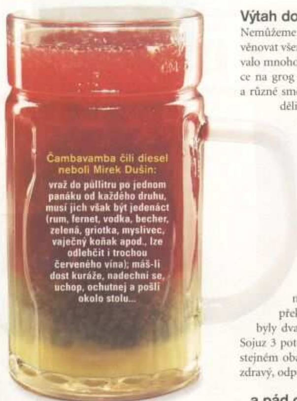
Čambavamba čili diesel neboli Mírek Dušín: vraž do půllitru po jednom panáku od každého druhu, musí jich však být jedenáct (rum, fernet, vodka, becher, zelená, griotka, myslivec, vaječný koňak apod., lze odlehčit i trochou červeného vína); máš-li dost kuráže, nadechni se, uchop, ochutnej a pošl okolo stolu...