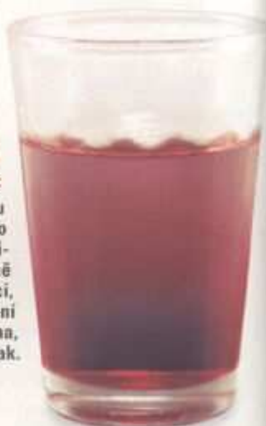
Polská vlejka, Polsko, plameňák nebo růžovka:

vlij do skla griotku a poté vodu; této receptuře čas neubli- žil, jde o vysloveně lahodnou kombinaci, jejíž vhodné složení je jedna ku dvěma, lze však i jinak.